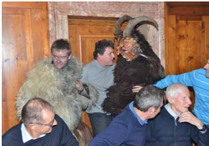
So mancher Lehrer und Schüler musste in die „Teufelkiste“ - auch Kammi konnte nicht schnell genug davonlaufen!

Wir würden sparen an Haufn Moos, würden wir den Willi los. Der Minister sollt erlassen, die Rechtschreibung unserem Dialekt anzupassen.