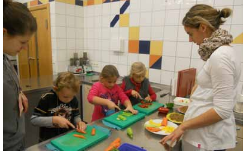
Besuch der VS Kramsach: Die Volksschüler der VS Kramsach genossen einen Vormittag mit den Schülerinnen des 3. Jahrganges an der FSH. Dabei erkundeten sie die Ställe mit Kälbern und Hühnern und richteten sich anschließend eine gesunde Jause unter der liebevollen Anleitung der Schülerinnen der FSH 3.

schuss der Bäuerinnen aus dem Bezirk Kufstein verwöhnen und die Weihnachtsfeier für den Bezirksjägersverband Schwaz in diesem Rahmen ausrichten. Ebenso hat die Lehrer-Arbeitsgemeinschaft der Hauswirtschafts- und Werklehrerinnen aus dem Bezirk Schwaz die Genussschule als Weiterbildungsveranstaltung gebucht. Weitere Veranstaltungen sind geplant (Infos dazu bei m.gschwentner@tsn.at ). Kulinarische Genüsse durften wir auch zur Jubiläumsveranstaltung des Projektes „Schmatzi“ beisteuern - Schülerinnen des 2. Jhg. gestalteten dazu ein Buffet. Ein intensiver Schulabschnitt liegt bereits hinter uns. Hauswirtschaft ist eben vielseitig und vernetzt, sie schafft Zu-