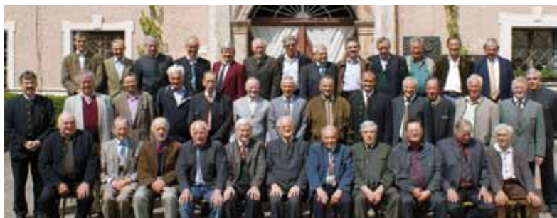
Die „50“-Jubilare freuten sich auf das Wiedersehen mit den ehem. Mitschülern und Lehrern.