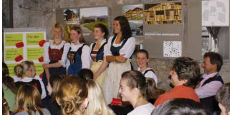
Die Mädchen des 2.Jhg der FSH Rotholz wurden bei Präsentation der Ausstellung „Weiterbauen am Land“ im Philippine Welsler Ausstellungsraum der LLA Rotholzaktiv eingebunden.