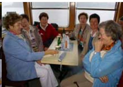
Ein Höhepunkt der Reise war der Galaabend „black and white“ mit einem 6 Sternemenü, das alle Teilnehmer restlos begeisterte. Trotz Regen war die Stimmung bei der Schifffahrt am Hallstättersee hervorragend!