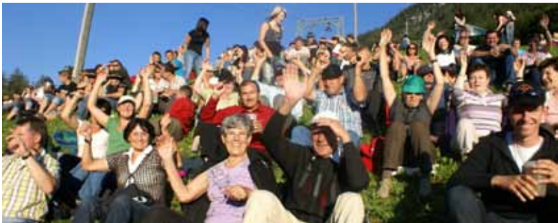
Der Rotholzer Fanclub beim Besuch des Seer Openair Konzertes am Grundlsee!