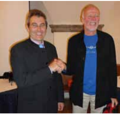
Direktor Norz überreicht zur Pensionierung ein Geschenk der Kollegenschaft.