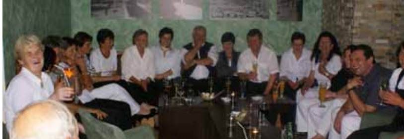
Die traditionelle Superstimmung beim nächtlichen Gedankenaustausch unter den Rotholzern im Wellnesshotel der Grimmingtherme war kaum zu überhören!

Nach dem Verzehr der steirischen Kaskrapfen gings zum Gruppenfoto für die 110 „Rotholzer“ mit Almpersonal auf der Viehbergalm der Fam. Gruber im Ausseerland.