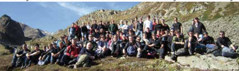
Überregionale Exkursion ins Stubaital mit 50 Teilnehmern vom Istituto Agrario San Michele all'Adige

Die SchülerInnen der 2. Klasse der Fachschule für Hauswirtschaft haben als erste Gruppen die neue, zwei tägige Exkursion „Klimavielfalt Obergurgl“ absolviert. Dabei hat sich gezeigt, dass zwar ein wenig Anstrengung nötig ist, um in die unberührten Hochgebirgslandschaften des Naturparks Ötztal vorzudringen, es jedoch alle körperlich gesunden Teilnehmer bis auf die Zunge des Rotmoosfernens geschafft haben - eine tolle Leistung! Auch das Wetterglück hatten die Damen auf ihrer Seite, sodass sie Mitte Oktober auf über 2500m noch mit angenehmen Temperaturen belohnt wurden.