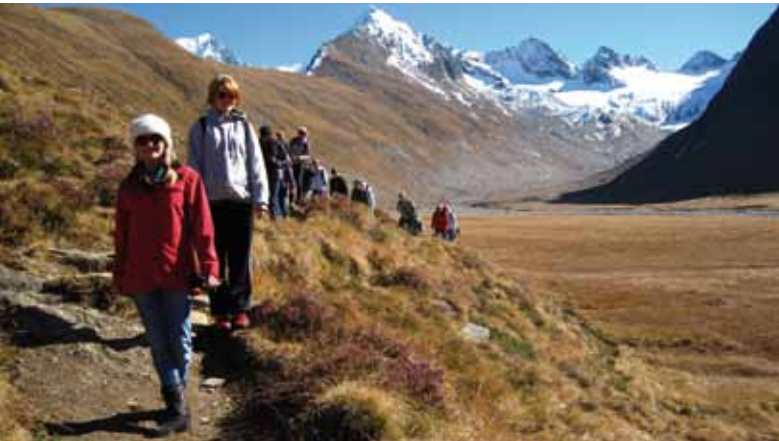
FSH Rotholz auf dem Heimweg vom Rotmoosferner Richtung Zirbenwald.