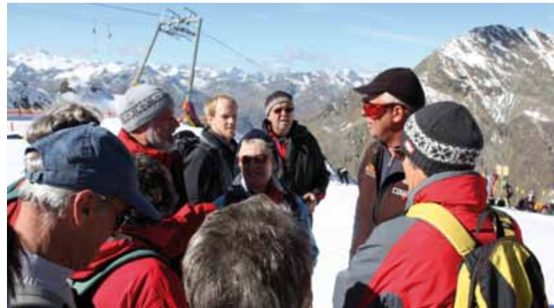
Forum Land Mitglieder erhalten Informationen über die Stubaier Gletscherbahnen.